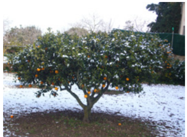
Orangenbaum im Schnee!!